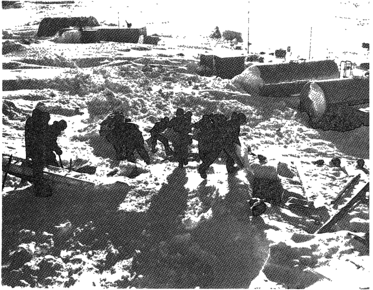
図 1 造水槽への雪入れ作業