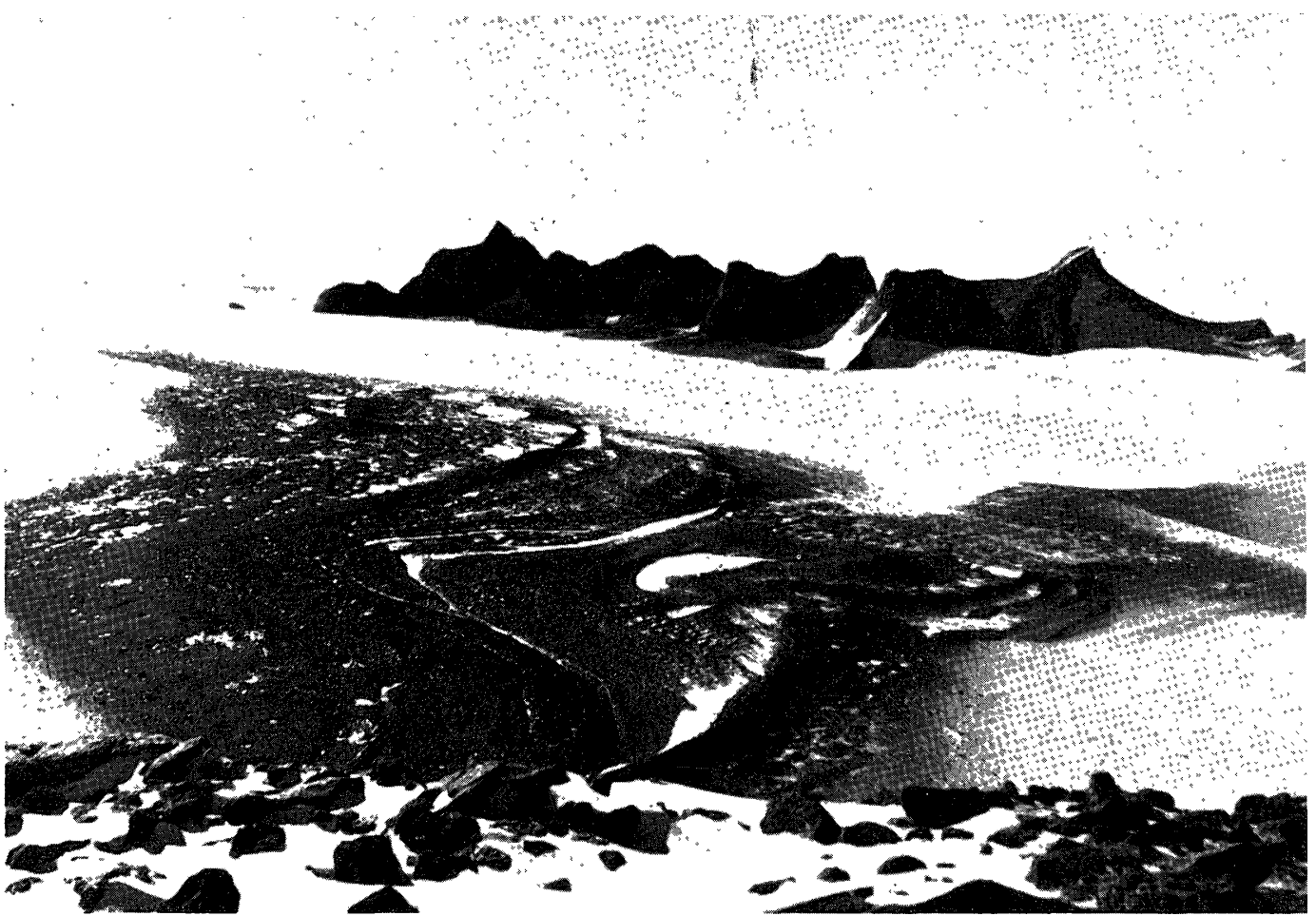
Photo. 1. G group viewed from the summit of F. A moraine field stretches between F and G.

写真 1. F 頂上から G をみる. F と G の間には moraine が拡がっている.