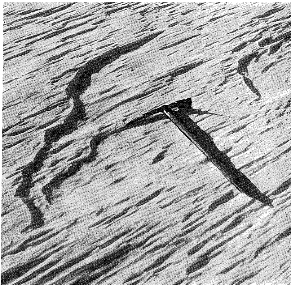
写真 16-2 各溝が成長すると、まず主に縦方向に互いに連なり合い、ついで横方向にもそれが行なわれる。

Photo. 16-2 The grooves lengthen and link up with each other along the direction of prevailing wind, and then the linkage take place towards direction perpendicular to the former.