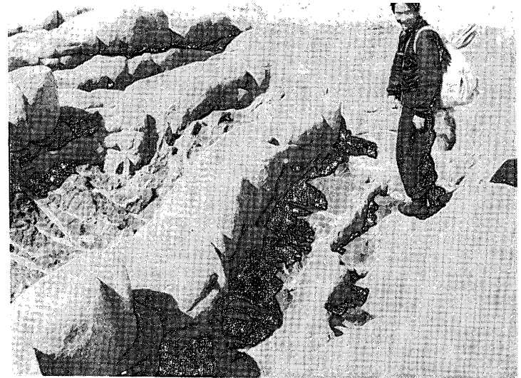
写真 12. 石英長石質片麻岩と塩基性変成岩との互層に働いた差別浸蝕 (ラングホブデ地区レブスネス島)。

Photo. 11. Hexagon-like fissure pattern produced by mechanical weathering. Undulating surface represents polished surface by glaciation on which striations are well carved (northern part of Skallen district).