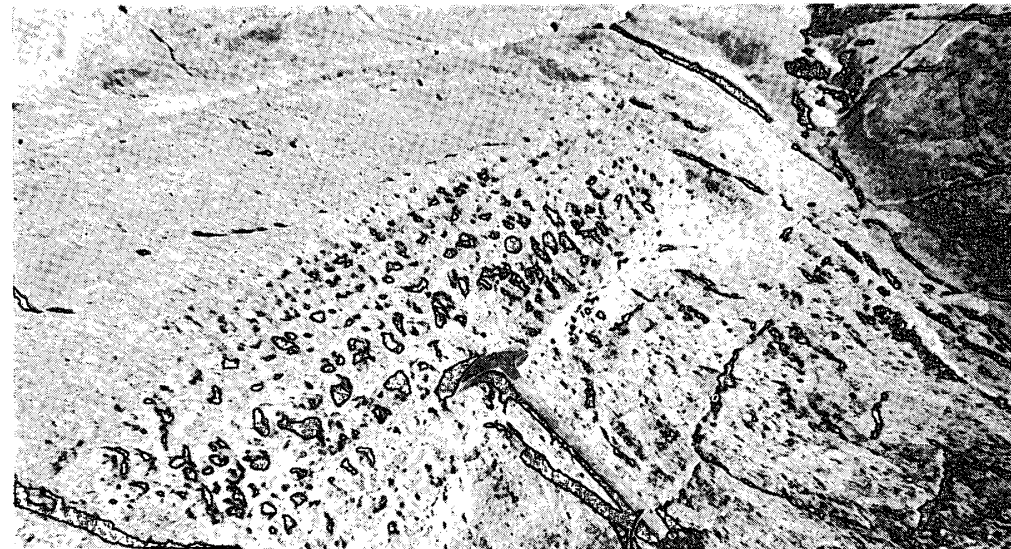
写真 13. 一岩体内でもある層準にのみ生じた“蜂の巣岩” (東オングル島)。

Photo. 12. Differential erosion observed on alternation of quartzofeldspathic gneiss and basic metamorphic rock (Revsnes Island, Langhovde district).