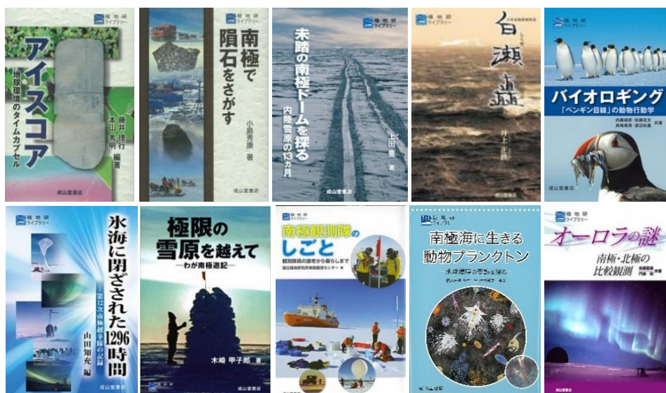
極地研ライブラリー