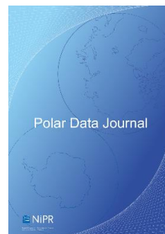
Polar Data Journal

https://www.sciencedirect.com/journal/polar-science