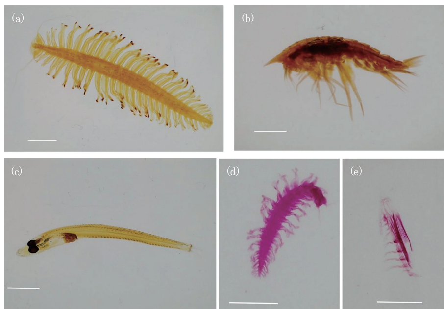
図 3 試作 2 回目の標本例。 (a) Tomopteris sp. 収縮が生じなかった。 (b) Cyphocaris sp. 気泡が減った。 (c) Nototheniidae 樹脂の体内への浸透が良く透明度が高い。 (d) Tomopteris sp. 及び (e) Rhincalanus gigas ローズベンガルによる染色例。スケール： (a), (b), (c) = 10 mm； (d), (e) = 5 mm。

Fig. 3. Sample specimen of the second trial manufacture. (a) Tomopteris sp., No shrinkage occurred. (b) Cyphocaris sp., Bubbles decreased. (c) Penetration of Nototheniidae resin into the body is good, and transparency is high. (d) Tomopteris sp. and (e) Rhincalanus gigas , Dyeing example by Rose Bengal. Scale: (a), (b), (c) = 10 mm; (d), (e) = 5 mm.