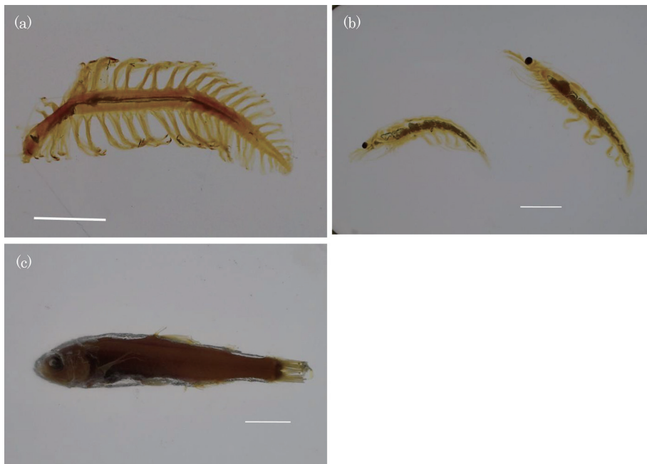
図2 試作1回目の品質の悪い標本例。(a) Tomopteris sp. 胴部・ いぼあし 疣足に収縮が生じた。(b) Euphausia superba 頭胸節上面を中心に大量の気泡が生じた。(c) Myctophidae 樹脂と動物の間に浸出液による層が見られる。スケール：(a), (b), (c) = 10 mm.

Fig. 2. Sample specimen with a poor quality of the first trial manufacture. (a) Tomopteris sp., Shrinkage occurred in body part and parapodia. (b) Euphausia superba , A large amount of bubbles occurred around the upper thoracic surface. (c) Myctophidae , A layer of leachate is seen between resin and animals. Scale: (a), (b), (c) = 10 mm.