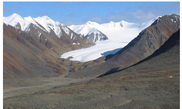
(b) August 2004 (1959 年から 45 年後)