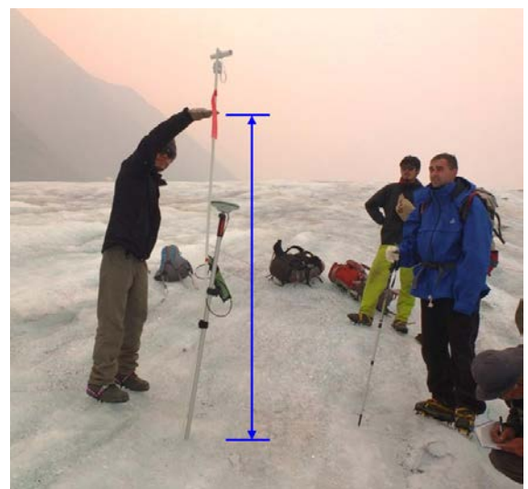
Fig.2 消耗域（末端付近）での融解（約 180cm）