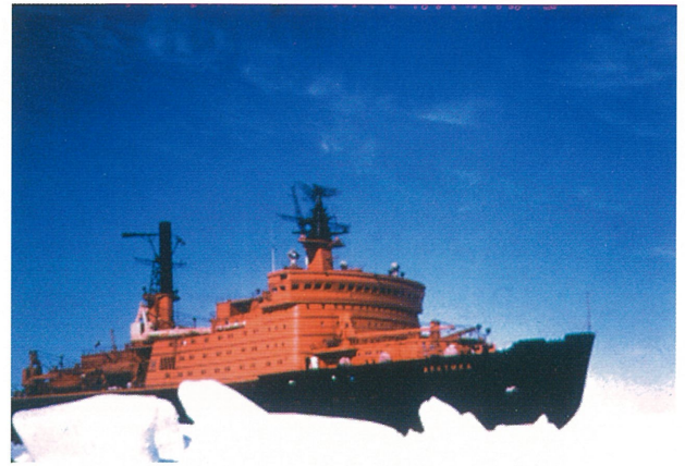
NSRを行くロシアの原子力砕氷船「アークティカ」

INSROPは、技術的には年間を通じたNSRの航行は可能であると結論づけている。しかしながら、商業利用に向けた最大の課題はその経済性で、スエズ、パナマ経由の航路に対する競争力をいかに高めるかが問題となっている。耐氷型貨物船建造コストや保険コストの高さ、不明瞭なロシアの水先案内料、砕氷船費用、通行料に加え、氷海の航行スケジュールの信頼性も予測が困難であることから、西側諸国の海運関係者は一般に近い将来の利用については懐疑的、