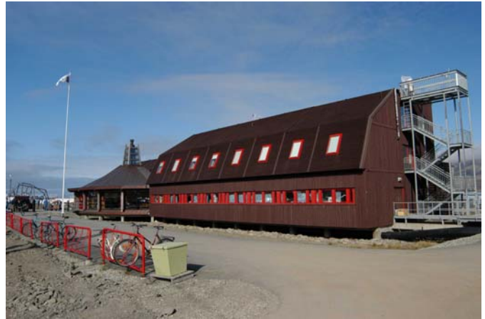
写真1 UNIS全景 新しい建物がこの右側に建設されている

参考 館山一孝(1999):スバルバル大学コース滞在記. 雪氷、61、472-476。