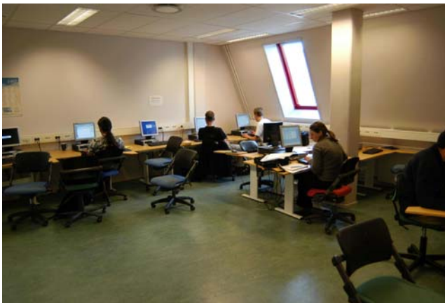
写真2 UNISのコンピュータールーム