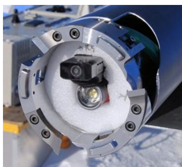
Fig.2. Video camera system