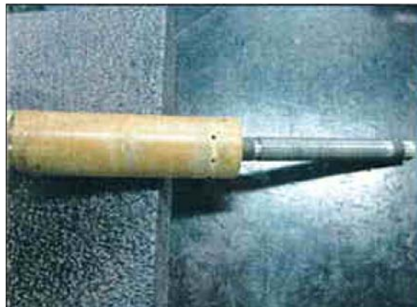
Figure 1. Displacer continuous operation for two years.

超伝導重力計 (OSG#058) の今後の課題としては、現在、容器内圧は 0.07Psi になるように制御されているが、急激な気圧変動により気圧が 980hpa を通過するとき容器内圧が低下し、ヒーターが連動して内圧を上げようとするが、そのとき図3に示すように Tilt PWR も影響を受けて優乱状態になることである。容器内圧が 0.07Psi のとき制御電流は 27mA 程度であるが、容器内圧が低下して場合は最大で 42mA 程度となる。この状態の解決策として容器内圧の設定を 0.09 Psi 程度に上げることで制御電流がどのように変化するか試験したいと考えている。なお、これが起こるのは 0.03-0.04Hz の高周波側で起こり、ローパスフィルターを使用することで朝夕解析には影響を与えていない。