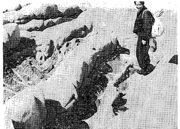
写真 12. 石英長石質片麻岩と塩基性変成岩との互層に働いた差別浸蝕 (ラングホブデ地区レブスネス島)。

Photo. 11. Hexagon-like fissure pattern produced by mechanical weathering. Undulating surface represents polished surface by glaciation on which striations are well carved (northern part of Skallen district).